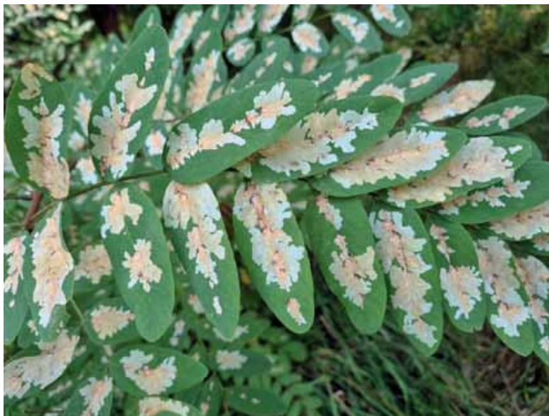
Obrázok 4. Poškodenie 40 – 50 % plochy listov agáta nepôvodným druhom motýľa psotka agátová Parectopa robiniella Figure 4. Damage, 40 – 50% of surface, to black locust leaves by a non-native species, the locust digitate leaf miner Parectopa robiniella .

pový Phyllonoricter issikii , psotka agátová Parectopa robiniella (obr. 4), vrtivka orechová Rhagoletis complana , obrubnica americká Leptoglossus occidentalis , ploskáčik platanový Phyllonoricter platani a ďalších.