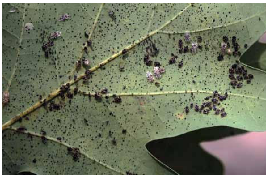
Obrázok 3. Kolónia C. arcuata na spodnej strane listu Figure 3. A colony of C. arcuata on the underside of a leaf.